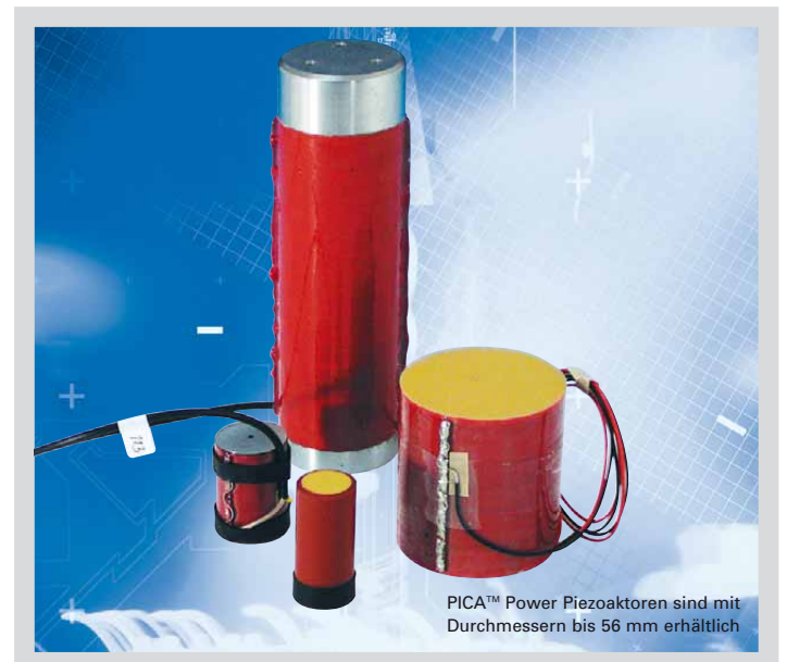
PICA™ Power Piezoaktoren sind mit Durchmessern bis 56 mm erhältlich

PI bietet eine große Auswahl an Verstärkern und Controllern für Piezoaktoren an, von Einkanalmodulen über Digitalcontroller bis hin zum Hochleistungsverstärker E-481 mit 2000 W dynamischer Leistung. PI entwickelt auch kundenspezifische Piezoelektroniken (s. S. 2-99 ff).