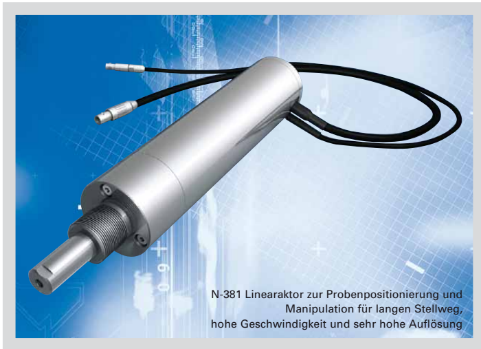
N-381 Linearaktor zur Probenpositionierung und Manipulation für langen Stellweg, hohe Geschwindigkeit und sehr hohe Auflösung