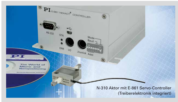
N-310 Aktor mit E-861 Servo-Controller (Treiberelektronik integriert)